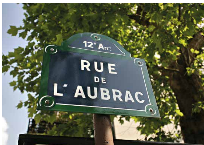
Rue de l'Aubrac Paris 12 e