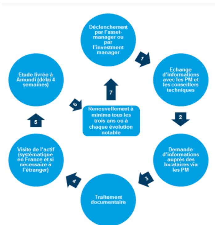
Figure 1 : Processus mis en place pour la réalisation d'une Cartographie :

La notation est construite de la manière suivante : la notation ESG des fonds labellisés ISR comprend conformément aux exigences du Label ISR des fonds Immobiliers, 9 indicateurs d'impacts parmi les critères du Label (voir point 6.2). Ils sont classifiés en deux catégories suivies annuellement : les Indicateurs obligatoires et les indicateurs supplémentaires. Les pondérations des domaines sont précisées ci-dessous et les exigences du label ISR y sont détaillées.